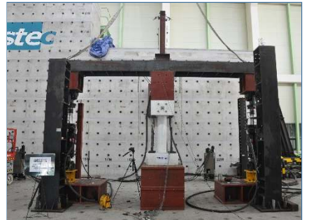
교각 하이브리드 성능실험