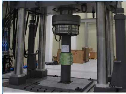
강관 연결부 압축 성능실험