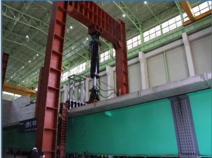
60m 도로교 성능실험