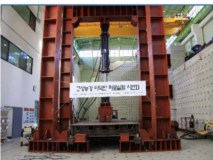
강바닥판 피로 성능실험