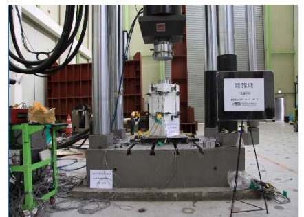
정착구 하중전달 성능실험