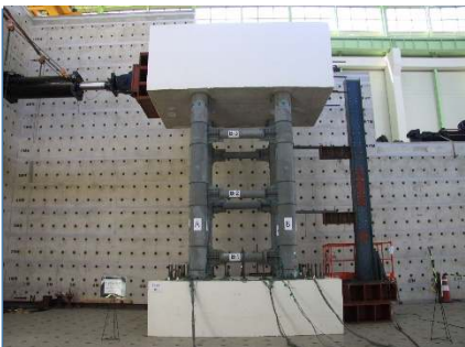
CFT 교각 성능실험