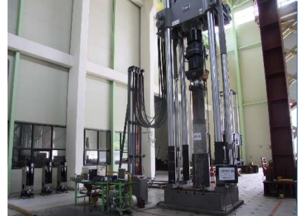
복합말뚝 압축 성능실험