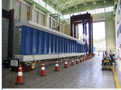
50m 철도교 성능실험